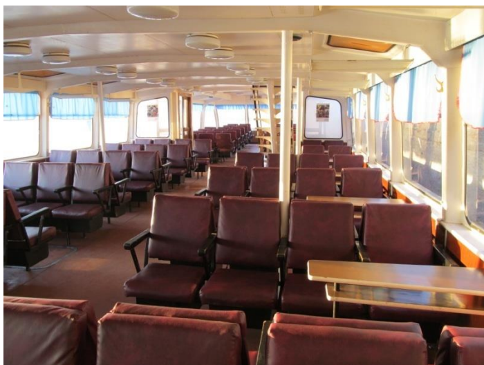
НИЖНИЙ УРОВЕНЬ ( «зальный» )