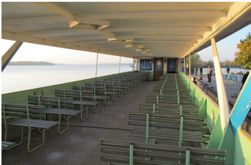
ВЕРХНИЙ УРОВЕНЬ ( «террасный» )