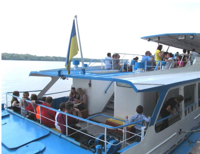
НА КОРМЕ ( задней части )