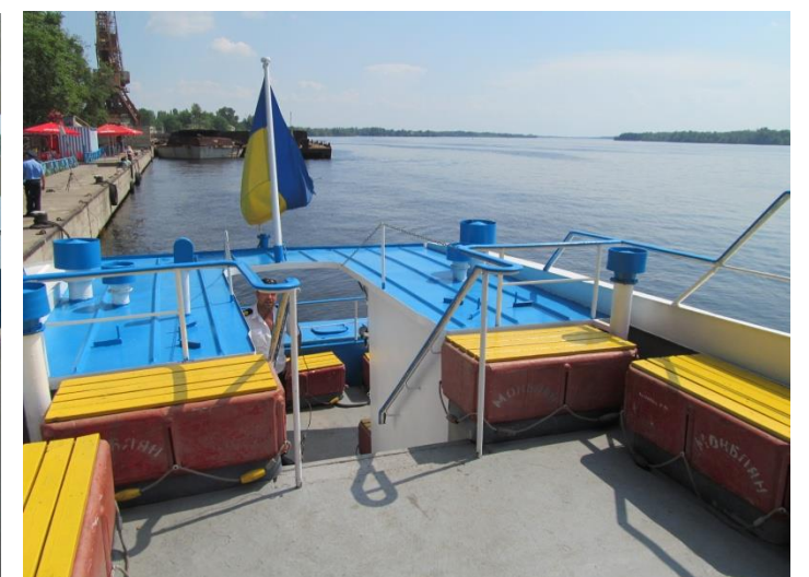
сидушки на корме ВЕРХНЕГО УРОВНЯ