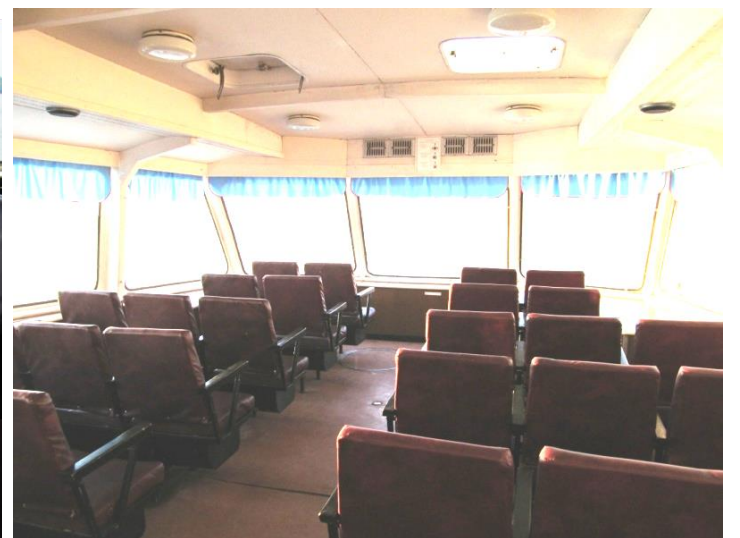
Передняя ( носовая ) часть нижнего уровня