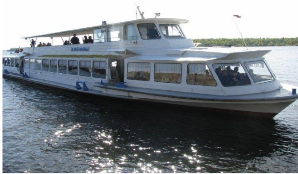
ОБЩИЙ ВИД КРУИЗНОГО ТЕПЛОХОДА