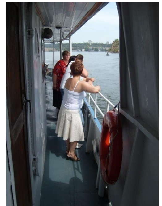
галерея НИЖНЕГО УРОВНЯ